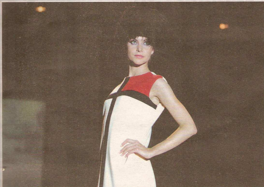
Chaque vêtement était présenté avec un flash historique pour se remémorer le contexte de son époque.