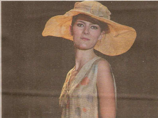
Toutes les robes présentées étaient issues de la collection du MuMode.